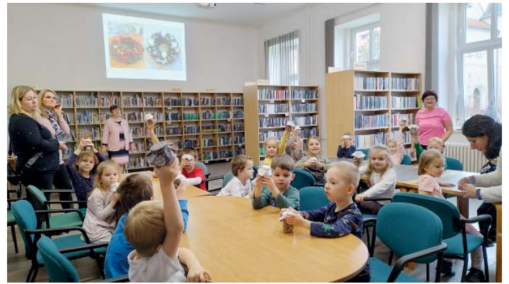
MŠ Sládečkova - vánoční tvoření.