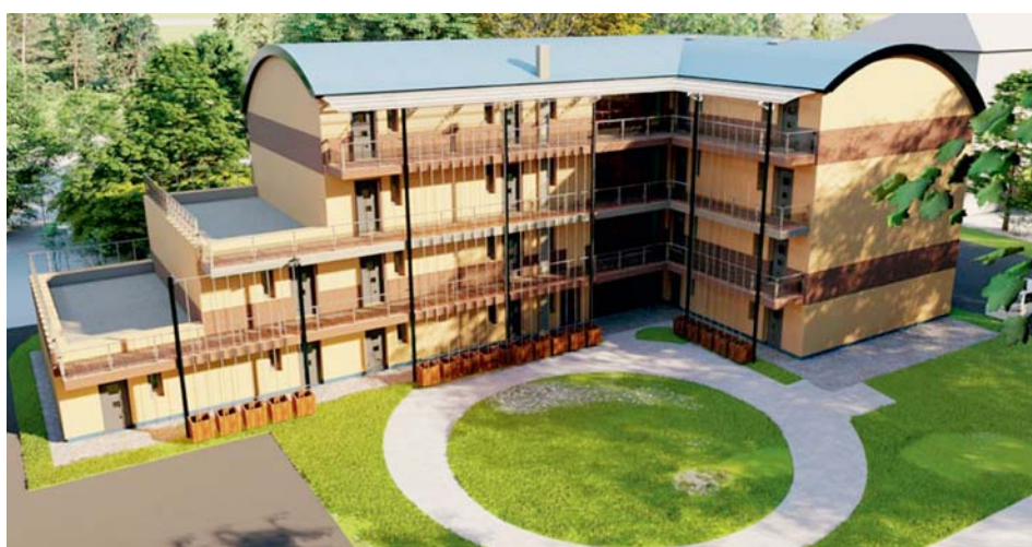
Vizualizace bytového domu. Věříme, že díky získané dotaci se brzy stane realitou.

Byli jsme proto velice rádi, když k nám dorazily první informace o nově chystaném dotačním programu Státního fondu na podporu investic. Program dostupné nájemní bydlení kombinuje podporu formou dotace a formou zvýhodněného úvěru. V případě našeho bytového