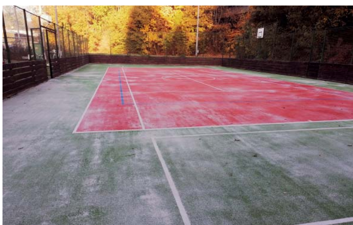
Hřiště po regeneraci.

Další opravy areálu hasičské zbrojnice a herních prvků budou následovat, a to tak, aby na jaře 2025 areál přivítal návštěvníky v původní kráse a znovu sloužil obyvatelům Michálkovic.