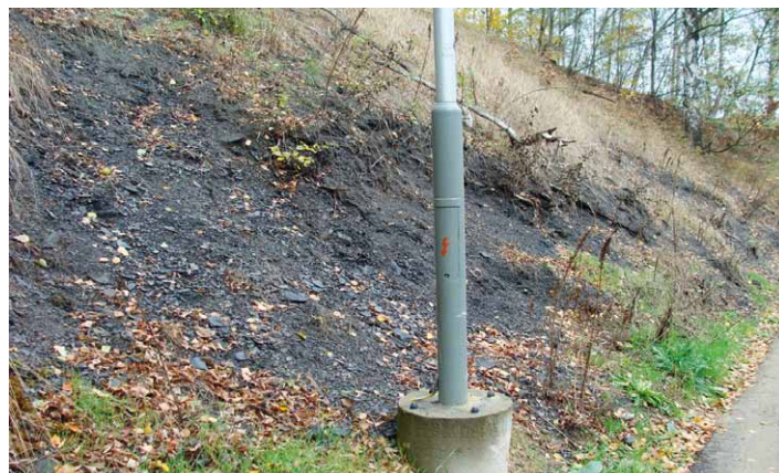
Svah odvalu podél ul. Liškova

Sklon svahu bude následně zredukován. U paty svahu bude proveden val z lomového kamene. K odvádění povrchových vod bude obnoven odvodňovací žlab u paty svahu.