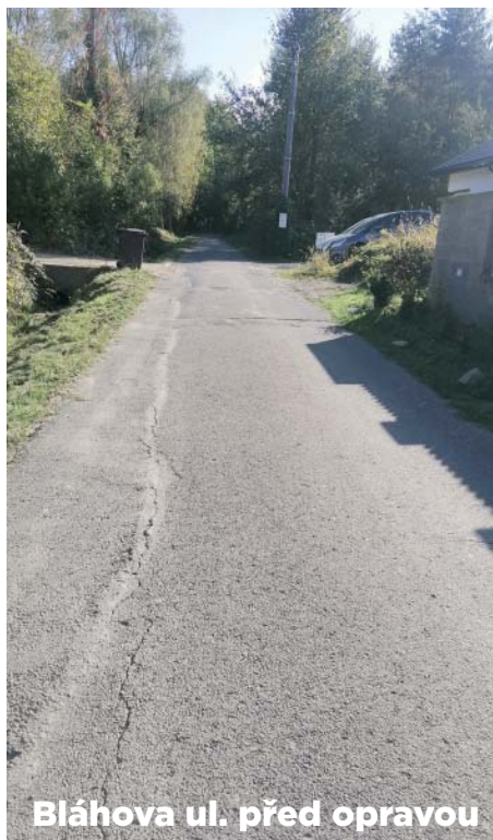
Bláhova ul. před opravou

Městský obvod má zpracovány rozpočty i na opravu několika zbývajících komunikací vyžadujících opravu, stejně jako na rekonstrukci komunikace Binarovy, která si vyžádá zvýšené investiční náklady.