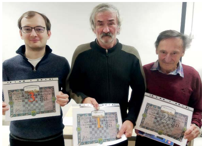
Medailisté turnaje Michálkovický koníček 2021.

Turnaj se zabydlel v prostorách komunitního centra, které skýtají pro šachová klání výborné podmínky. Organizátoři turnaje znovu musí poděkovat pracovním komunitního