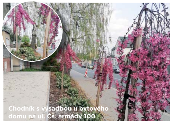
Chodník s výsadbou u bytového domu na ul. Čs. armády 100