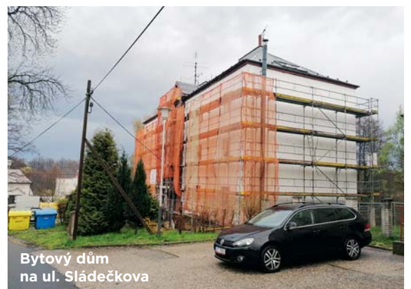
Bytový dům na ul. Sládečkova