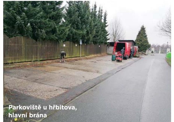
Parkoviště u hřbitova, hlavní brána

Provoz na současných atrakcích nebude v průběhu stavby přerušen, nýbrž jen na velmi krátkou dobu organizován stavební firmou.