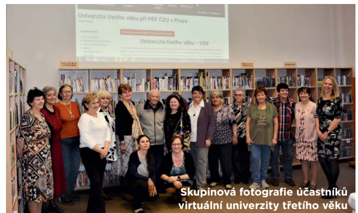
Skupinová fotografie účastníků virtuální univerzity třetího věku

7. 6. nás navštíví družina ZŠ U Kříže, pro kterou si Silvie Hillová připravila program.