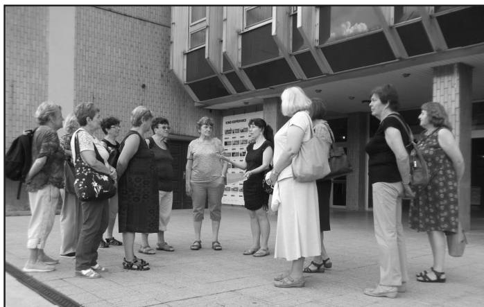
Účastnice zájezdu před knihovnou v Kopřivnici

menších dětí, předala všem rodičům drobné dárečky a dárkové poukázky, které umožní rodičům přihlásit své dítě do knihovny zdarma a vybrat si hezké knížky z bohaté nabídky.