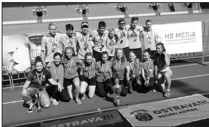
Vítězné kraje - dorost

Ostravský městský stadion patřil v druhém červnovém víkendu mladým hasičským sportovcům. Kolektivy Mladých hasičů a dorostenců zde bojovaly o postup na Mistrovství ČR. Ostravu reprezentovali mladí hasiči z Michálkovic a Heřmanic. V dorostenecké kategorii pak dorostenci z Michálkovic a dorostenky z Nové Vsi.