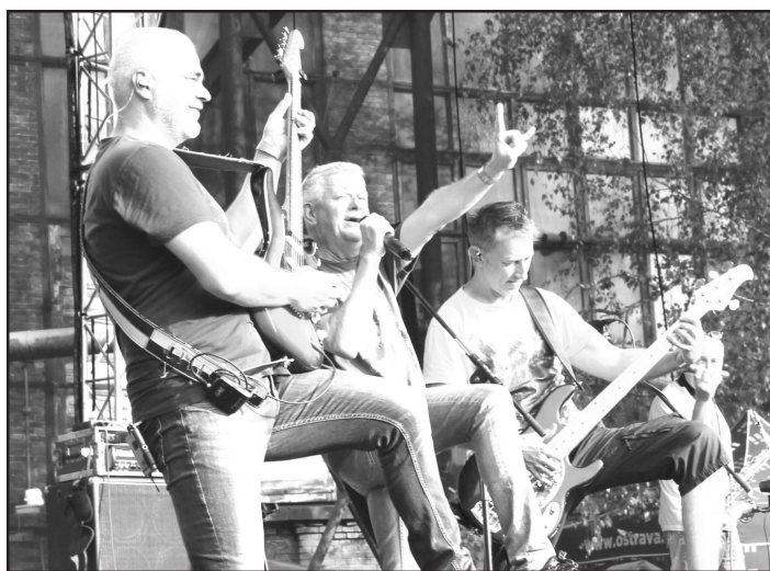
Mňága a Žďorp

MICHÁLKOVICKÝ ZPRAVODAJ – periodický tisk územního správního celku • Měsíčník vydává statutární město Ostrava, městský obvod Michálkovice, Československé armády 325/106, 715 00 Ostrava – Michálkovice • IČ 00845451/16 • E-mail: posta@michalkovice.ostrava.cz, www.michalkovice.cz • Registrační číslo: MK ČR E 12771 • Šéfredaktor: Ing. Martin Juroška, Ph.D., tel.: 606 664 648, e-mail: mich.zpravodaj@seznam.cz • Sazba a zlom: Fa GRASA, Ostrava – Michálkovice • Tisk: MORAVAPRESS, s.r.o., Ostrava • Uzávěrka příštího čísla 10. 8. 2019