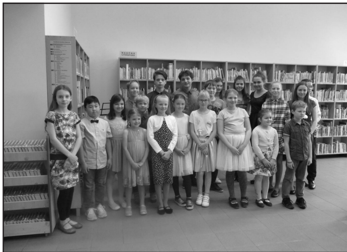
Žáci koncertu ZUŠ Edvarda Runda v michálkovické knihovně

Poté jsme navštívili Muzeum Tatra, které je otevřeno v současných prostorách od roku 1997. Nabízí návštěvníkům na ploše 5 000 m 2 šest desítek modelů tohoto vozu, který se v Kopřivnici vyrábí už od roku 1897. Tatra je druhou nejstarší automobilkou na světě.