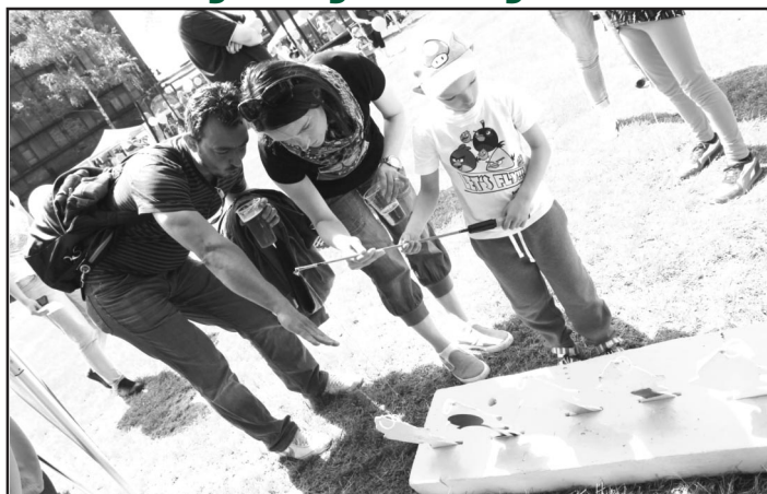
I v minulém roce si na hasičském Dni dětí užívali soutěže děti i rodiče

Hned dvě organizace pořádají tradičně v Michálkovicích akce spojené s oslavou dne dětí. Svůj den dětí chystají jak naši rybáři, tak i hasiči.