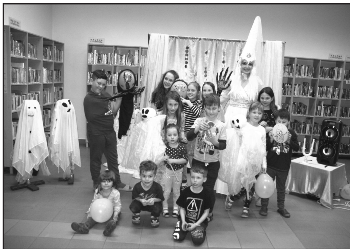
Noc s Andersenem si děti náležitě užily a už teď se těší na další ročník