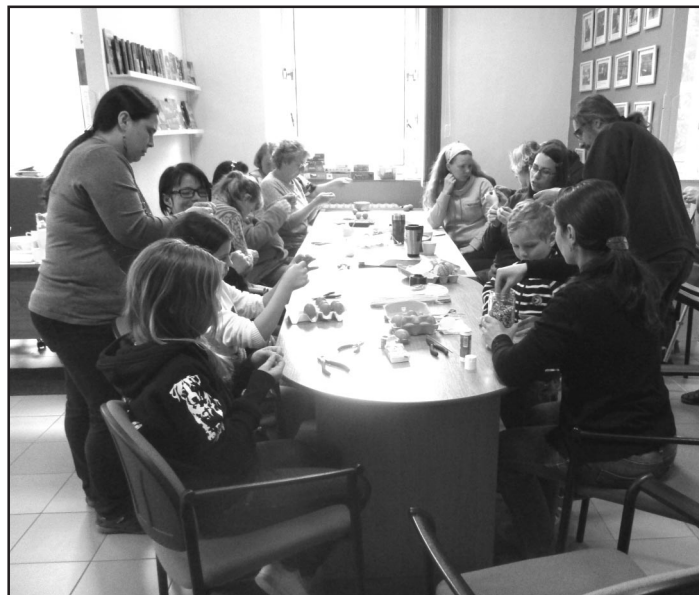
Členové kmene Wabash učili zájemce drátkování vajíček