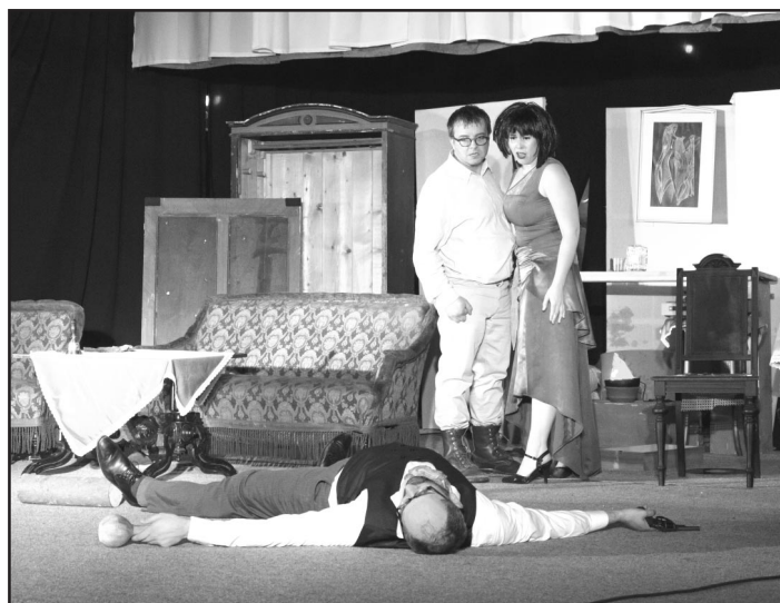
Lidové divadlo Krnov s inscenací „Mátový nebo citron?“

Máme v Michálkovicích jeden podivuhodný dům. Budova na pohled zvenčí docela běžná, nikterak architektonicky zajímavá, ba dokonce snadno přehlédnutelná. Přesto je pro mnohé přespolní symbolem Michálkovic, a to dokonce známějším možná víc, než Národní kulturní památka Důl Michal.