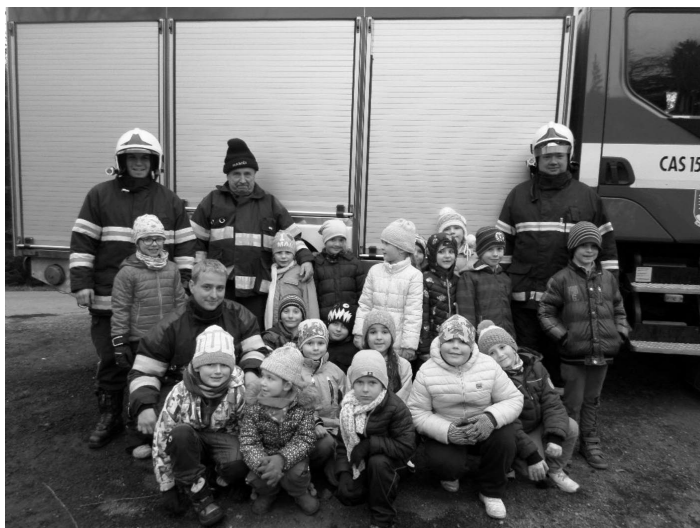
Hasiči z Horní Bečvy u našich prvňáčků

Vynalézali a vytvářeli modely, vyzkoušeli svoje schopnosti v oblasti vývojové práce, myšlenky a projekty pak ve skupinách prezentovali před svými spolužáky. Přínos této akce je především ve zdokonalení schopnosti žáků pracovat v týmu, naučit se pracovat podle pokynů jiných vedoucích než školních pedagogů, v uplatnění originality a nápaditosti každého žáka v technických oborech, ve schopnosti pochopit, posoudit a ocenit práci jiného než vlastního týmu. A možná že se s některými nápady našich žáků setkáme i někdy v budoucnosti.