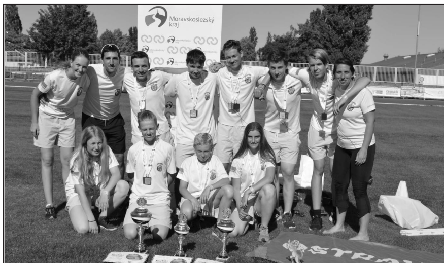
Městský obvod Michálkovice podporuje každoročně činnost michálkovických hasičů

Městský obvod Michálkovice se jako v předchozích letech opět v měsíci únoru zapojil do výběrového řízení pro poskytnutí transferů z rozpočtu statutárního města Ostravy za účelem zabezpečení prevence kriminality na rok 2019. Ze strany městského obvodu byly podány dva projekty: „Hřiště pro veřejnost v Michálkovicích“ a „Otevřený klub pro děti a mládež v Michálkovicích“. V rámci projektů žádáme město o finanční prostředky na provoz dvou hřišť v Michálkovicích a také na činnost otevřeného klubu pro děti, který v průběhu celého roku připravuje odpolední program a řadu krásných akcí pro děti i v době školních prázdnin.