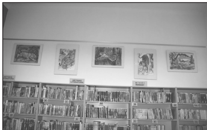
Obrazy Ludvíka Kunce mají už své místo v michálkovické knihovně