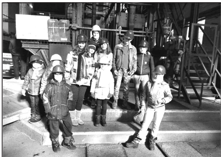
Děti navštívily Hornické muzeum Landek

Jarní prázdniny jsou za námi a nám nezbyvá než bilancovat jejich průběh v dětském klubu. V podstatě jsme je prožili v neustálém pohybu. Pondělí 4. února bylo ve znamení návštěvy muzea v Ostravě. Děti se seznámily nejen s historií města, ale navštívily také geologickou výstavu. V úterý si své geologické poznatky ověřily při návštěvě Hornického muzea na Landeku. Návštěva byla spojená s „faráním“ do hlubiny země, kdy jsme navštívili štolu v hloubce 2,5 metrů pod úroveň krajiny. Cesta dolů byla komplikovaná, a to již z toho důvodu, že jsme uvízli ve výtahu. Ve středu jsme zajeli trochu dále – navštívili jsme Opavu. Zejména její proslulé muzeum. Děti byly nejvíce nadšené vycpaným sloním mládětem, které uhynulo v ostravské ZOO. Poutavý výklad průvodce a film popisující práce v časové posloupnosti při konzervaci slona vedl děti k zamyslení nad situací nejen v chovu, ale komplikovaností prací při zachování exponátů v muzejnictví. Ve čtvrtek jsme