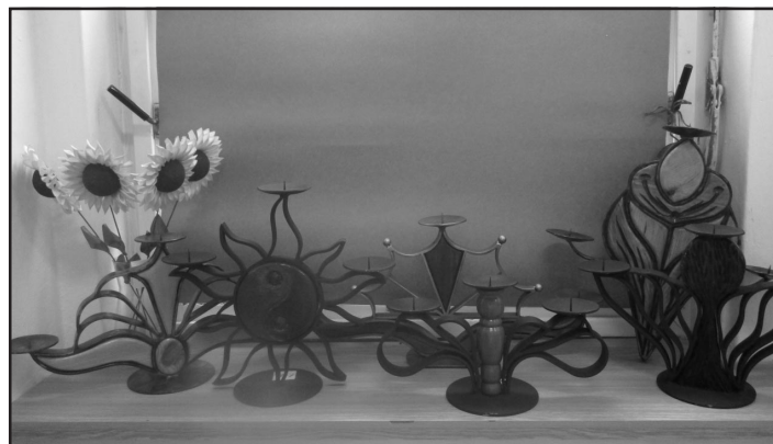
Výstava svíců Zdeňka Holíka