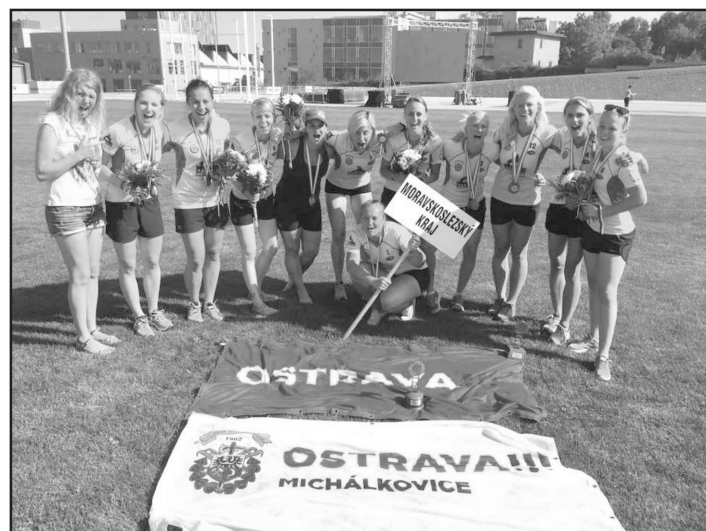
Družstvo žen SDH Michálkovicce