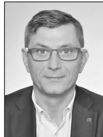
Senátor Zdeněk Nytra

vu, Starou Bělou, Vítkovice - a 4 samostatné obce: Starou Ves nad Ondřejnicí, Šenov, Václavovice a Vratimov. (jk)