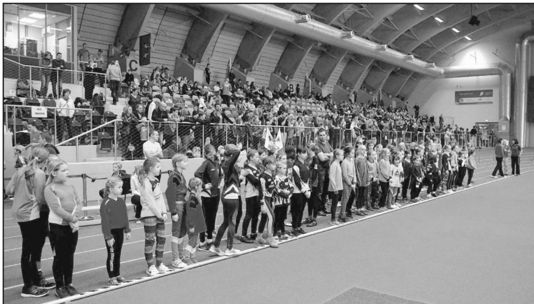
Účastníci Ostravsko-Beskydských šedesátek

Mužům se sice podařilo postoupit do krajského kola, kde však opět postupové naděje ztroskotaly na poslední