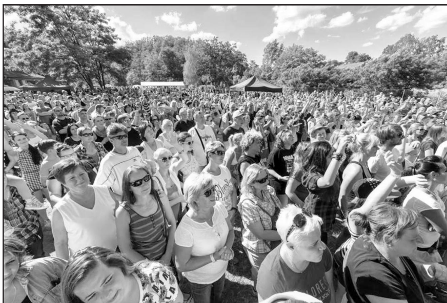
Loňský MichalFest přivítal bezmála tři tisíce návštěvníků