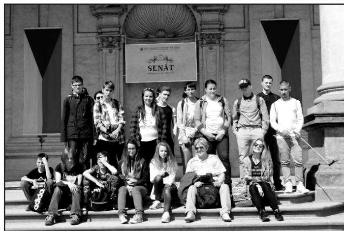
Žáci IX.B před budovou Poslanecké sněmovny Parlamentu ČR

Ve dnech 24. a 30. května 2017 se žáci obou devátých tříd zúčastnili kurzu první pomoci, který díky spolupráci s Českým červeným křížem (ČČK) proběhl v naší škole již poněkolkáté. V prvním, teoretickém bloku se žáci seznámili prostřednictvím výkladu zkušené lektorky, bývalé zdravotní sestry a vyučující na zdravotní škole, se zásadami první pomoci. Pod vedením žáků zdravotní školy, členů ČČK, si pak například na figuríně vyzkoušeli umělé dýchání nebo sami na sobě úvaz zraněné končetiny. Všichni oceňovali odborné znalosti školitelek, které byly ve stejném věku jako posluchači a dokázaly zajímavým, bezprostředním způsobem podat žákům důležité informace. Všichni absolventi kurzu obdrží od ČČK cer-