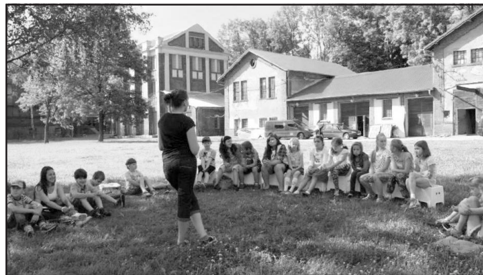
Děti na Dole Michal

venku. Děti ochutnaly chleba se sádlem, vyzkoušely si, jak velké prostory lidé dříve obývali a co jedli během významných svátků i v běžných pracovních dnech. Druhá skupinka se seznámila s