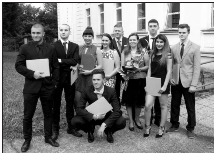
Maturanti Bezpečnostně právní akademie

všechny žáky pochválil. Zrovna byl Den dětí, tak taková pochvala dvojnásobně zahřála. Skutečnost, že žáci ZŠ U Křížce jsou opravdu ukáznění, o besedy mají zájem a vždy jsou svými pedagogy předem připraveni, zcela potvrzují i zkušenosti našich kolegů, které u nás prezentují besedy a žáky místní školy si nemohou vynachválit. Doufáme, že i v budoucnu budeme mít tak skvělou spolupráci jako doposud.