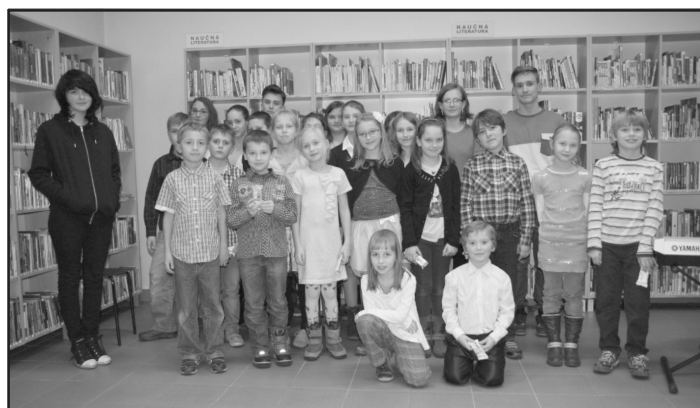
Děti ZUŠ Eduarda Runda, vystupující na vánočním koncertu