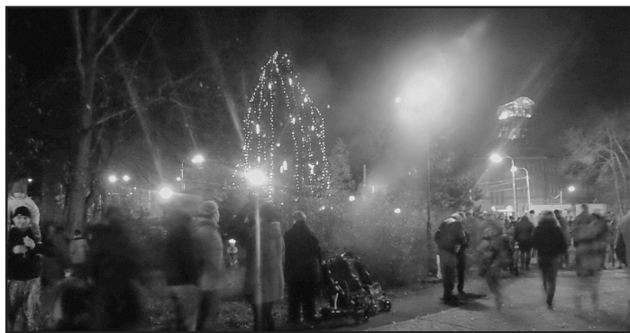
Vánoční strom na Michalském náměstí