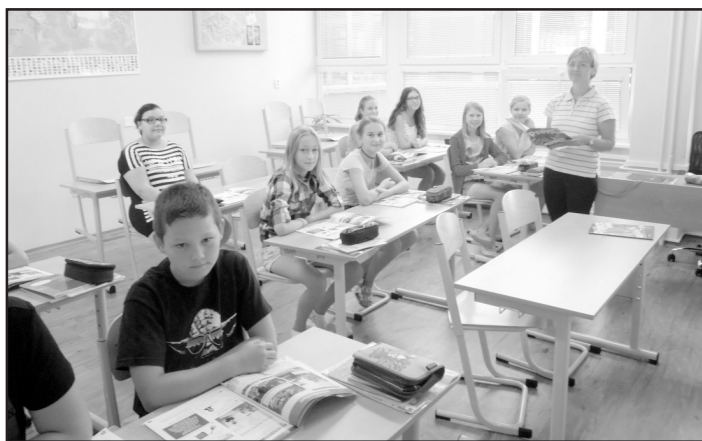
Jazyková učebna byla vybavena novým nábytkem