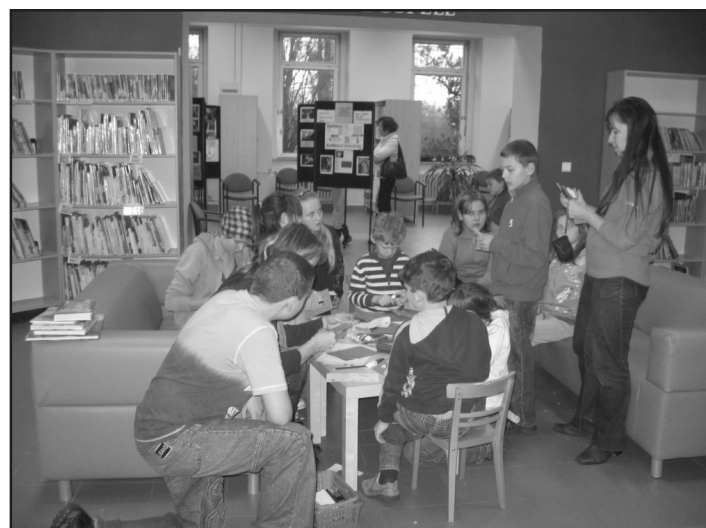
Výtvarné odpoledne - vyrábíme přáníčka a vánoční etikety z papíru.

Od tohoto čísla Michálkovickeho zpravodaje se budeme