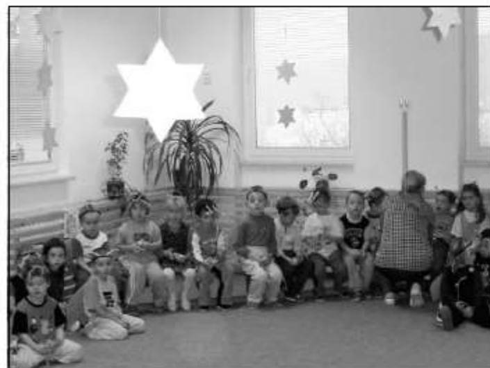
FOTA NA STRANĚ P. POLOK

léma ovlivnilo v novém roce 2006 i naše životy. To je moje vánoční přání a novoroční - přeji Vám, milí spoluobčané, pro celý nový