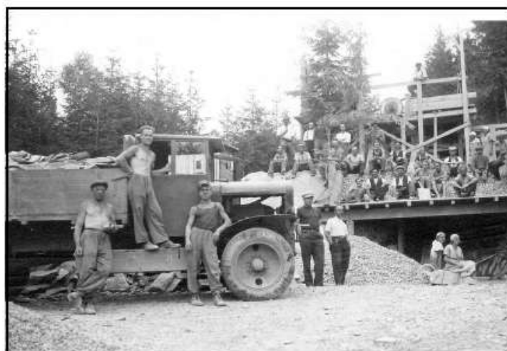
Horní snímek je z budování opavských opevnění před 2. světovou válkou, na dolním snímku rozvoz americké pomoci UNRA v roce 1945.