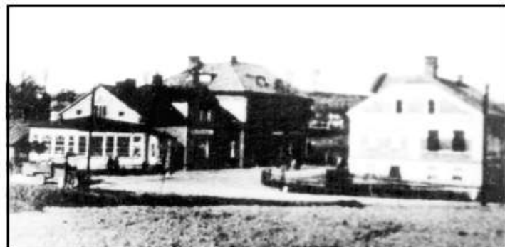
Zprava pekárna Pikoň, naproti obchod Pělucha a vedle hospoda Stuchlík na dnešní křižovatce ulic Petřvaldské a Radvanické.

Výčet je pravděpodobně neúplný. Kromě stálých prodejen, byly prodejny sezonní, které přivázely zákazníkovi do domu brambory a ovoce všeho druhu. V této době nebyl jediný neočesaný strom, nebyl problém dovézt meruňky nebo hrozny z jižní Moravy na Ostravsko. Lidé museli tvrdě a hospodárně pracovat, vážili si práce a všech produktů, které jim příroda poskytovala.