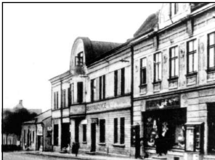
Na snímku vlevo papírenské zboží Šusta, vpravo textil Kuběna.