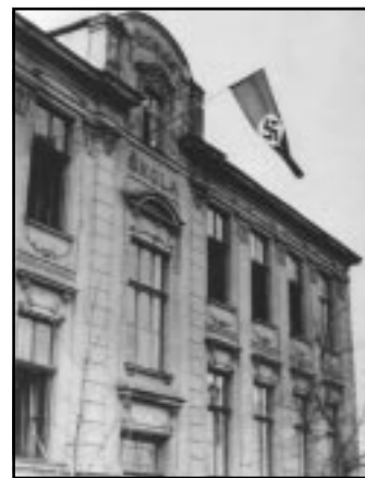
Škola na Sládečkově ulici v době protektorátu.