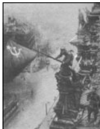
Závěr druhé světové války: Sovětsí vojáci, starší seržant M. Jegorov a režant M. Kantaria vztyčují dne 30. dubna 1945 sovětskou vlajku nad Reichstagem v Berlíně.