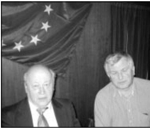
Několik fotozáběrů z 13. zasedání Zastupitelstva Městského obvodu Michálkovic pořídil pan Petr Gilg.