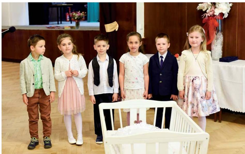
Děti z mateřské školy pravidelně vystupují na vítání občánků.