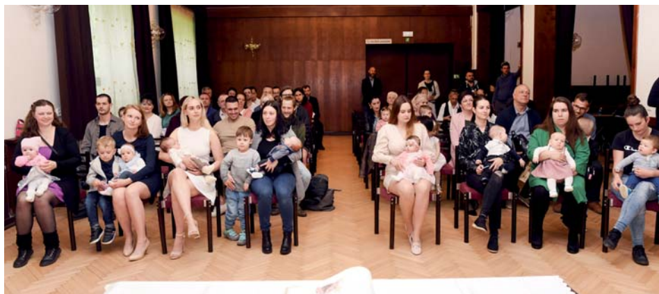
Při jarním vítání občánků jsme přivítali osm narozených dětí.