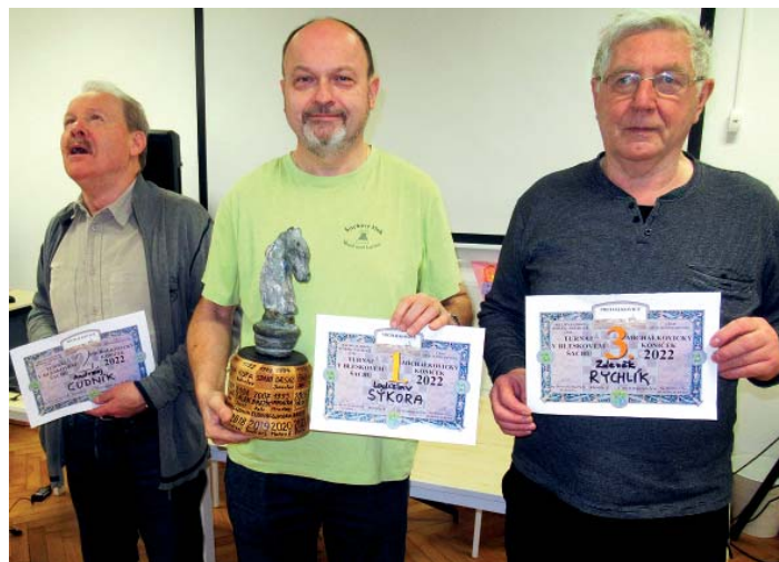
Medailisté turnaje Michálkovický koníček 2022.

Turnaj se již tradičně konal v příjemných prostorách bývalé vily Hermína v Ostravě-Michálkovicích, která nyní slouží veřejnosti jako komunitní centrum. Turnaj se hrál systémem každý s každým na 7 kol s tempem 2 x 10 minut na partii a jako rozhodčí jej řídil RNDr. Ladislav Sýkora, který turnaj před léty založil a jehož osud zavál až do Veselí nad Lužnicí. A byl to právě on, který odvezl na jih Čech putovní sošku pro vítěze, neboť i přes zaneprázdně-