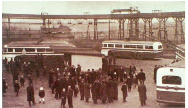
Fotografii ze zahájení trolejbusového provozu poskytl Ing. Petr Mitáček

Trolejbusový provoz byl pak významně narušován rekonstrukcemi v centru. Nejprve od 8. června 1969 do 1. června