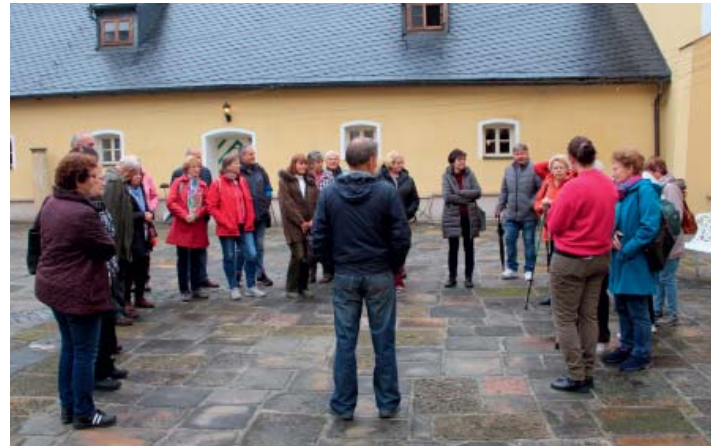
Klub seniorů - rychvaldský zámek.