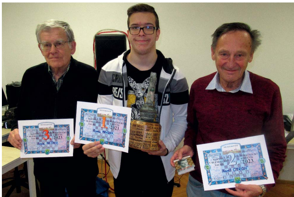
Medailisté turnaje Michálkovický koníček 2023.