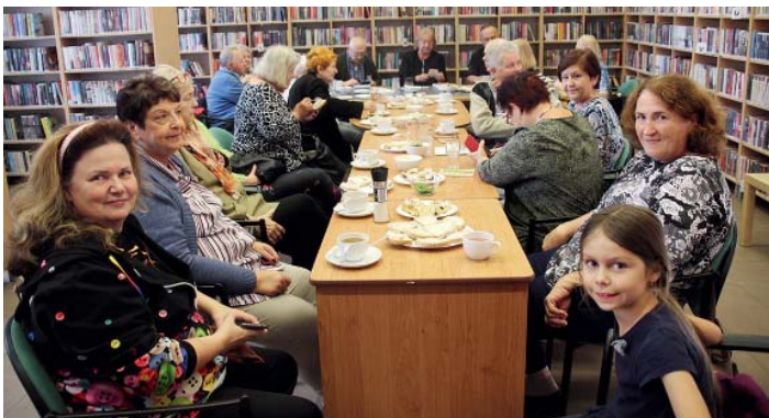
Hornická kuchařka v knihovně.

» Hornická kuchařka a její tři autoři k nám zavítali 4. 10. Kromě ochutnávky výborných koláčů z Kozmic jsme si dali i havířský řízek, což je chleba se sádlem ochucený pažitkou a cibulí. Zároveň jsme ten den oslavili i osmnácté výročí naší knihovny v této krásné budově.