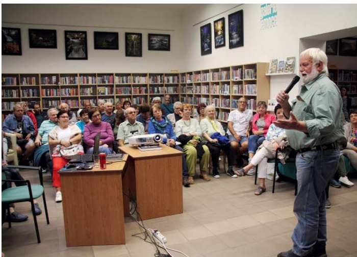
Richard Konkolski vypráví o svých zážitcích

» V říjnu jsme přivítali i českého mořeplavce světového jména, pana Richarda Konkolského. Na besedu přišli i jeho kamarádi z dětství a bývalí spolupracovníci, takže knihovna praskala ve švech pod přílivem návštěvníků. Pan Konkolski prodával i své knihy a s každým zájemcem ochotně zapožoval a nechal se vyfotit.