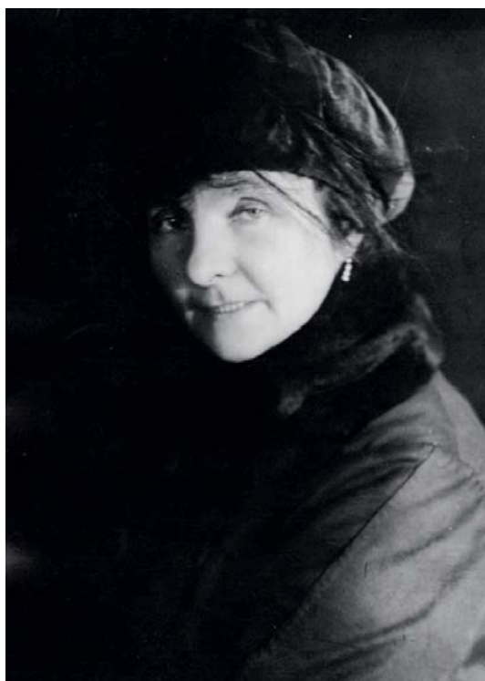
Anna Maria Tilschová (1873-1957)

Začala proto často jezdit do Moravské Ostravy, Vítkovic, Nového