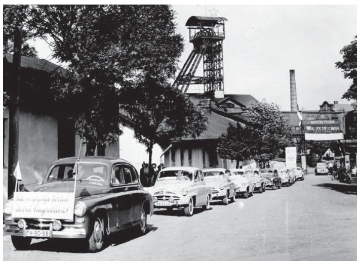
Horníci dolu Petr Cingr jedou do prvomájového průvodu.