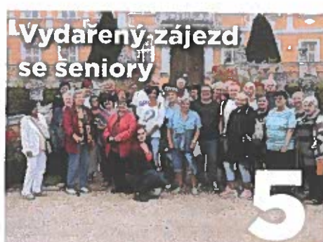
Vydařený zájezd se seniory