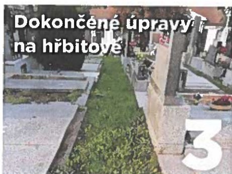
Dokončené úpravy na hřbitově