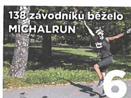
138 závodníků běželo MICHALRUN