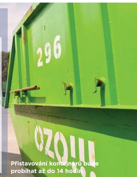
Přistavování kontejnerů bude probíhat až do 14 hodin.